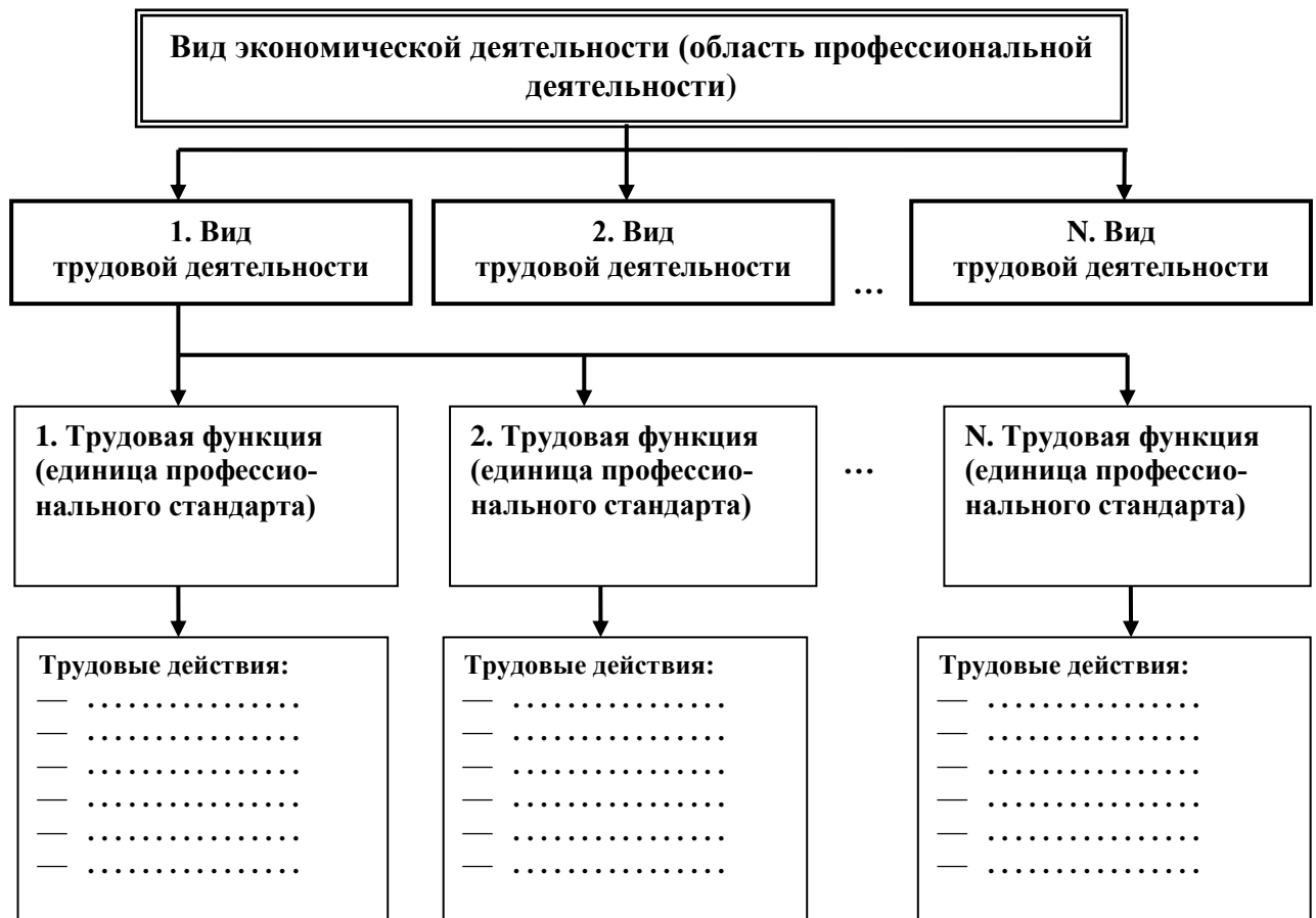
Схема 1. Структура вида экономической деятельности